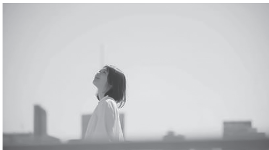
図4 CM2「いま、この世界で」 01:06 (カラー映像)

想像を超える現実だった。」という文字が重なる。このパートは、無力な「犠牲者」として「第三世界」の人びとを描く表象の典型例といえる。だが、ここからCMはトーンを一変させる。開始23秒付近で音楽が途切れ、画面は日本人女性のクローズアップに戻る。直後、ドーンという低い破裂音が鳴ると同時に、閉じていた女性の口元が何かにつと気づいたようにわずかに開く。続いて「 いま、この世界で、命を落とす理由が女の子だからなんて、あってはいけない。 」というテロップとナレーションが挿入され、これを合図に弦楽器とピアノの混合した明るいアップテンポの曲が始まり、音楽はそのまま終盤にかけて音量を上げていく。これ以降、映像はすべてカラーとなり、鮮やかな色彩の静止画像と動く映像が次々に切り換わる。本を腕に抱える制服の少女、ミシンを動かす若い女性、自然のなかを駆け回る子どもたち、大縄跳びやサッカーをして体を動かす少女たちなど、躍動感に溢れる映像が続く。映像の切り換え速度も大きく変化している。前半(開始～31秒まで)は6個のショットから成るのに対し、後半(31秒～エンディング1分38秒)は35個であり、時間あたりのショット数が大幅に増加する。後半は、短いショットの連続が音響効果と組み合わせることで全体の疾走感を高めている。この合間にも、画面はたびたび女性主人公のもとに戻り、「私のいる、この世界が変わっていくんだ。」「遠かった国が近づいていく。」といったテロップがこの女性の意識変容を言語化する。このように本CMは、「犠牲者」的状态に置かれた少女たちが「ポジティブ」な