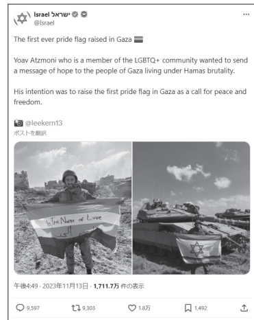
図2 23年11月13日、イスラエル広報局の投稿

この意味で権力とはまさに定義権であり、我々は今、暴力が誰によって、どのような権力構造の