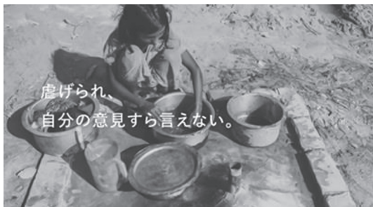
図3 CM2「いま、この世界で」 00:10 (モノクロ映像)

想像を超える現実だった。」という文字が重なる。このパートは、無力な「犠牲者」として「第三世界」の人びとを描く表象の典型例といえる。だが、ここからCMはトーンを一変させる。開始23秒付近で音楽が途切れ、画面は日本人女性のクローズアップに戻る。直後、ドーンという低い破裂音が鳴ると同時に、閉じていた女性の口元が何かにつと気づいたようにわずかに開く。続いて「 いま、この世界で、命を落とす理由が女の子だからなんて、あってはいけない。 」というテロップとナレーションが挿入され、これを合図に弦楽器とピアノの混合した明るいアップテンポの曲が始まり、音楽はそのまま終盤にかけて音量を上げていく。これ以降、映像はすべてカラーとなり、鮮やかな色彩の静止画像と動く映像が次々に切り換わる。本を腕に抱える制服の少女、ミシンを動かす若い女性、自然のなかを駆け回る子どもたち、大縄跳びやサッカーをして体を動かす少女たちなど、躍動感に溢れる映像が続く。映像の切り換え速度も大きく変化している。前半(開始～31秒まで)は6個のショットから成るのに対し、後半(31秒～エンディング1分38秒)は35個であり、時間あたりのショット数が大幅に増加する。後半は、短いショットの連続が音響効果と組み合わせることで全体の疾走感を高めている。この合間にも、画面はたびたび女性主人公のもとに戻り、「私のいる、この世界が変わっていくんだ。」「遠かった国が近づいていく。」といったテロップがこの女性の意識変容を言語化する。このように本CMは、「犠牲者」的状态に置かれた少女たちが「ポジティブ」な