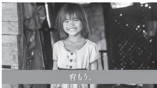
図2 CM1「親になる」 01:08 (カラー映像)

続く場面では、「遠い国の女の子の、親になりました。」というテロップの背後に再び男女4人のモデルが登場し、喜びの証とも慈愛の表現ともとれる微笑みを浮かべる。次に画面はにっこりと笑みを浮かべてこちらをみる少女の静止画像に切り換わり、画面下部には短く「育もう。」というテロップが表示される（図2）。続いて、同じく笑顔の少女を映した2枚の静止画像に「彼女たちが自分で人生を切り開く力を。」「未来を変える可能性を。」というテロップを表示したあと、「1日100円の支援で、女の子の親になりませんか。」という寄付の呼びかけがあり、プランのロゴが入った画面が挿入されてCMが終わる。この終盤のシーンで際