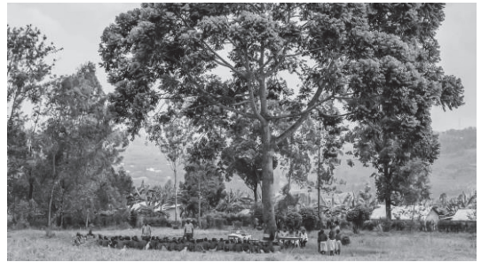
図6 CM3「まだ子どもなのに」 00:36 (カラー映像)

だが、児童婚をこのように単純化する見方は問題をはらんでいる。「女の子への投資」でメインテーマとされる児童婚撲滅の言説を分析したサイス・ベサ (Thais Bessa 2019) によれば、児童婚は地域共同体が強要する後れた慣習として描かれ、結婚を拒否して就学を継続する少女の決断は礼賛される。だが、「児童婚＝強制／就学＝自発的選択」という二元論の下では、飢餓や貧困から少女を逃れさせるためにやむなく結婚を手配したり、あるいは少女自身のみずから結婚を申し出たりといった意思決定の複雑さや、そうした実践の背景をなすグローバルな搾取構造が覆い隠されてしまう。また、コジャ＝ムルジ (Khoja-Moolji 2015) が論じるように、児童婚撲滅運動の背景には、子ども／大人を実体的に区分するクロノロジカルな年齢観と大衆的な義務教育とを当然視する西欧近代の規範がある。就学を終えてから労働・結婚・育児へと移行する人生経路が自然とされ、子どもを大人から隔離する空間として学校が整備される。児童婚は、単線の発達の規範から逸脱するがゆえに監視と介入の対象となり、幼い少女の純潔が脅かされるという家父長主義的な危機意識を刺激する。このCMも同様に、「早すぎる結婚は教育を受ける機会を奪います。」「彼女たちの多くは早すぎる結婚の弊害も出産の悪影響も知りません。」「 女の子たちに、自分の人生を自分で選ぶ権利を。 」といったテロップやナレーションを通じて、児童婚と就学をトレードオフの関係で描き、妊娠・出産の知識や人生選択の意思決定が就学によって無条件に保障されるかのようなメッセージを発している。児童婚を一様に悲劇化し、就学を解決策とする図式は、単に国際協力の現実を歪めるだけでなく、日本社会にも通底する性差別の現実から視線を逸らす効果をもつ。具体的には、日本におけるリブ