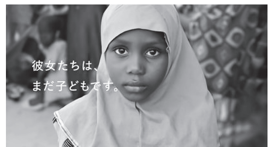
図5 CM3「まだ子どもなのに」 00:23(カラー映像)

次のシーンでは画面が上下左右均等に4分割され、それぞれの区画に若い女性の顔写真が次々と切り換わりながら呈示されていく。すると低いピアノの一拍を合図に、薄いブルーのスカーフで頭部を覆った少女が何かを訴えるようなまなごしでこちらを直視する写真が画面手前に浮か出るようにして示され、そこに「彼女たちは、まだ子どもです。」というテロップが付される(図5)。次いで、水色のシャツを着た少女が無表情でこちらをみつめる写真と、「学ぶことも、未来を描くことも、必要です。」というテロップが映される。そして再び低いピアノサウンドが響くと同時に2人の若い女性の顔写真が1枚ずつ順に表示され、そこに「 女の子たちに、自分の人生を自分で選ぶ権利を。 」というテロップとナレーションが重なる。この中盤部分では、少女たちの孤独や脆弱性が強く印象づけられる。無数の顔写真に続けてひとりの少女を浮かび上がらせる映像効果により、個別具体的な顔の集合が、代表性を帯びた一個の象徴的