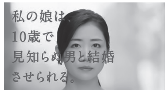
図1 CM1「親になる」 00:04 (カラー映像) (プランYouTube CMより抜粋。以下、同様)

「 知ってください 」と命令されたオーディエンスは、何か自分の「知らない」知識を教授されることを予期する。ここに一瞬の緊張が生じ、注意がテロップに引きつけられる。テロップは「私の娘は」という同一主語で始まる短文を4回反復する。もし仮にこれらのセンテンスがすぐさま腑に落ちる当然の内容ならば、「 知ってください 」という命令文と齟齬が生じ、広告表現としての意味を喪