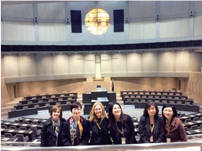
第 8 回 JAWS、東京都議会訪問

天候により断念した)を招聘し、国際シンポジウム「なぜアメリカで女性大統領は誕生しなかったのか?」を開催した。130 名を超える多くの聴衆が集まり大盛況だった。このほか、東京都議会訪問や、JAWS の新旧メンバー、ジェンダー研究所の研究者、お茶大の院生らとの研究交流も行った。