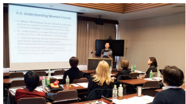
第 8 回 JAWS、お茶の水女子大学での研究交流会

JAWS の再開を兼ねてジェンダー研究所がアメリカからジュリー・ドーランとメリッサ・デックマン（マリアン・パリー教授も来日予定だったが、悪