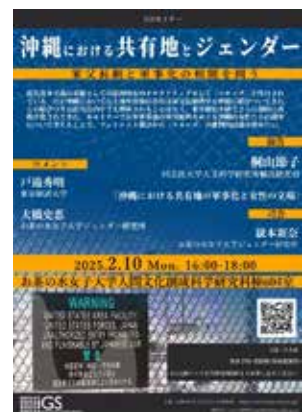
沖縄における共有地とジェンダー：家父長制と軍事化の相関を問う [本報告書 39 頁]