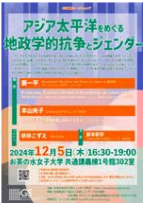
アジア太平洋をめぐる地政学的抗争とジェンダー [本報告書 35 頁]