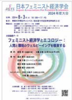
日本フェミニスト経済学会 2024 年度大会 フェミニスト経済学とエコロジー：人間と環境のウェルビーイングを模索する [本報告書 43 頁]