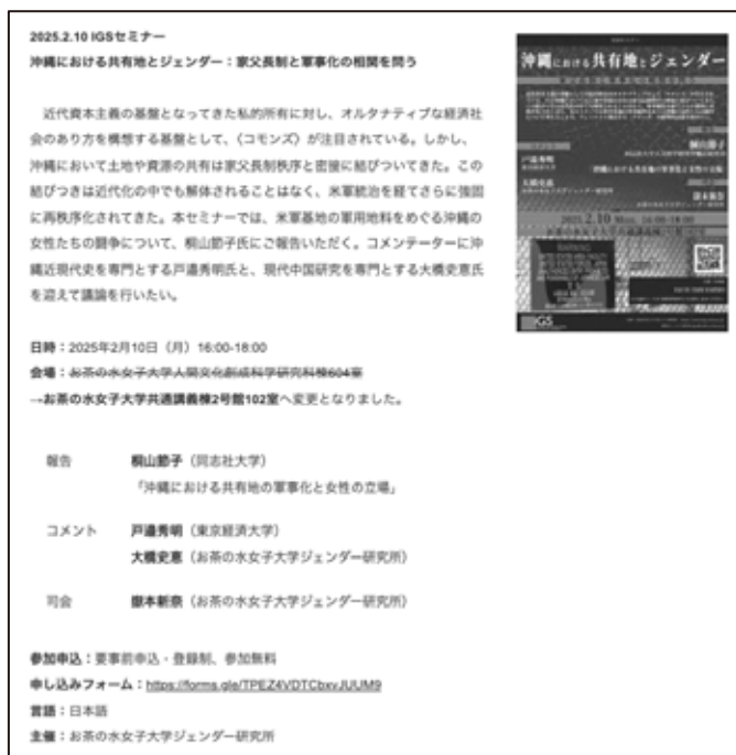
表ツールを使用し階層化した イベントページのレイアウト例

さらに、移行に伴い、サイトの表示速度を改善するために画像および PDF ファイルの最適化作業を実施した。これにより、読み込み速度の改善とサーバー負荷の軽減が期待される。さらに、現サイトがスマートフォン表示に対応していない問題を改善するため、新サイト移行の際にはテーマの見直し（必要に応じて再設計）と PHP バージョンの更新検討を行う。その上で、ローカル環境上でのサイト再現と動作検証の実施を進める予定である。また、現行ウェブサイトでは表示速度の改善を優先し、SNS の埋め込み機能を停止しているが、本来はサイトと SNS との相互連携を強化し、インタラクティブ性を高めたいと考えている。今後は、これを両立可能とする最適な手法の検討を進めていきたい。