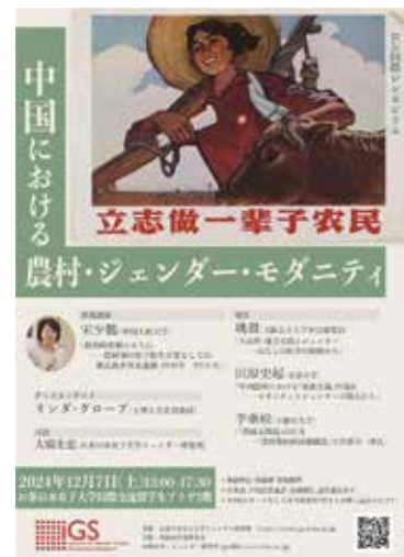
中国における農村・ジェンダー・モダニティ [本報告書 26 頁]