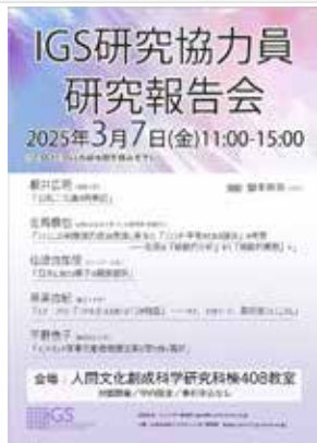
IGS 研究協力員研究報告会 [本報告書 41 頁]