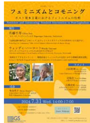
フェミニズムとコモニング：ポスト資本主義におけるフェミニズムの位相 [本報告書 23 頁]