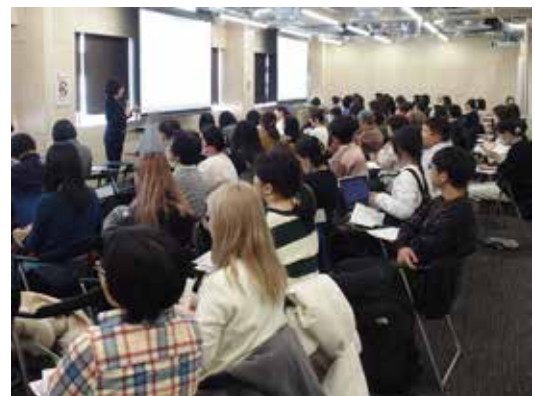
国際シンポジウム「中国における農村・ジェンダー・モダニティ(2024 年 12 月 7 日)」。