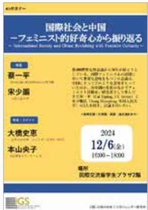
国際社会と中国：フェミニスト的好奇心から振り返る [本報告書 37 頁]