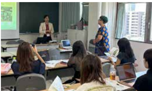
AIT ワークショップ・プログラムで来日したタイのアジア工科大学院大学の院生による研修報告会。お茶の水女子大学大学院ゼミの一環として開催された。