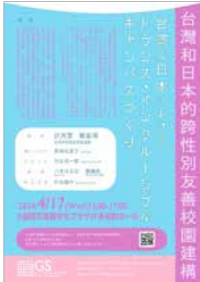
台湾と日本における、トランス・インクルーシブなキャンパスづくり [本報告書 29 頁]