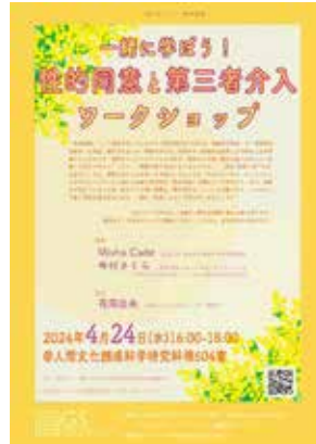
一緒に学ぼう！性的同意と第三者介入ワークショップ [本報告書 31 頁]