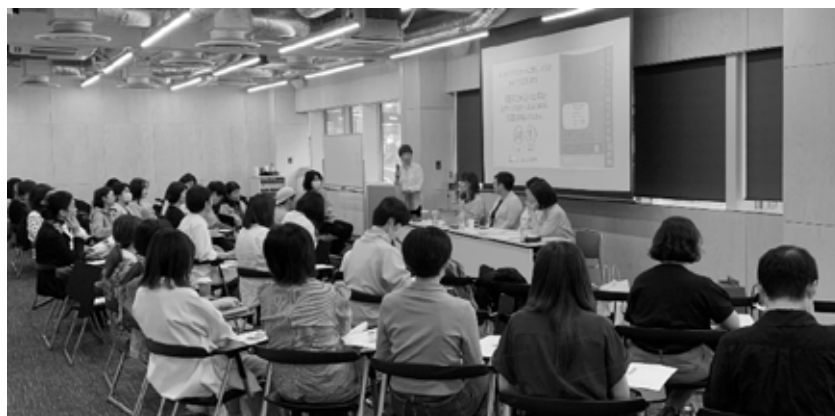
IGS セミナー「台湾と日本における、トランス・インクルーシブなキャンパスづくり」