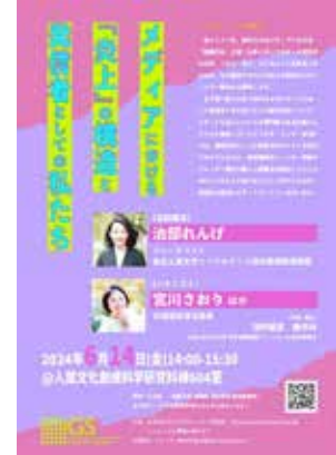
メディアにおける『炎上』の構造と発信者としての私たち [本報告書 33 頁]